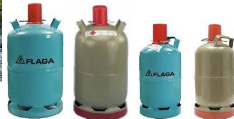
11kg- und 5kg-Stahlflaschen FLAGA oder graue Euroflaschen