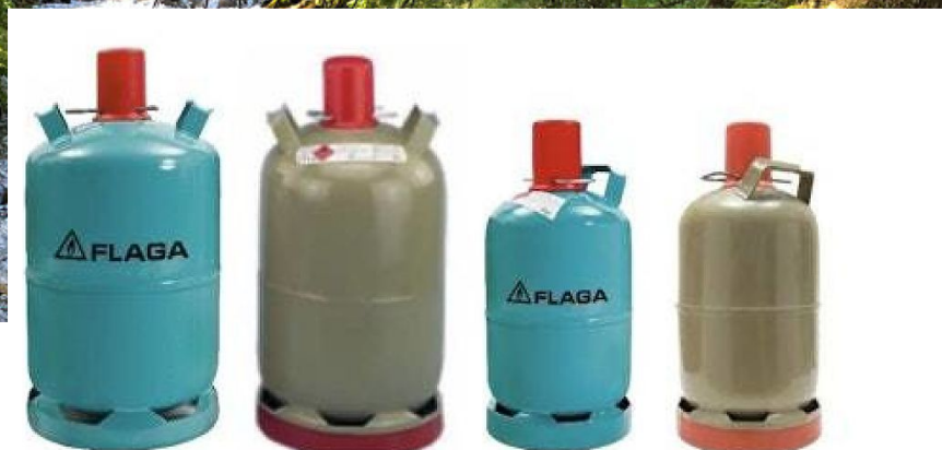
11kg- und 5kg-Stahlflaschen FLAGA oder graue Euroflaschen