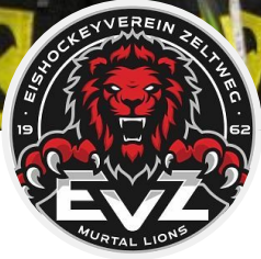
EV Zeltweg - Murtal Lions office@evzeltweg.at