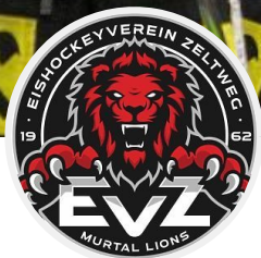
EV Zeltweg - Murtal Lions office@evzeltweg.at