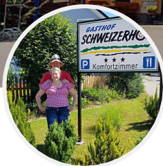
Gasthof Schweizerhof +43 3512 82060 office@schweizerhof-spielberg.at