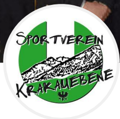
UNION Sportverein Krakau