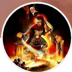
Feuerwehr St. Michael +43 3843 2300 kdo.019@bfvle.steiermark.at